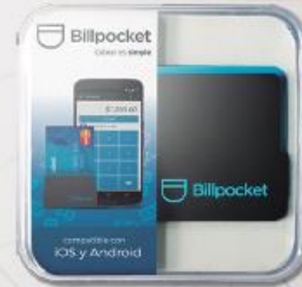
Billpocket (cobro con tarjeta)