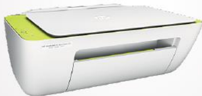
Impresora HP 2135