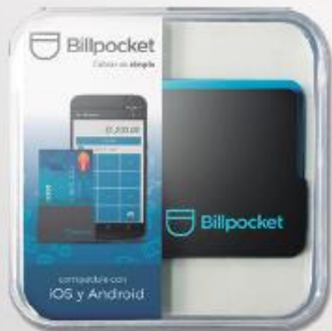
Dispositivo cobro tarjeta débito o crédito