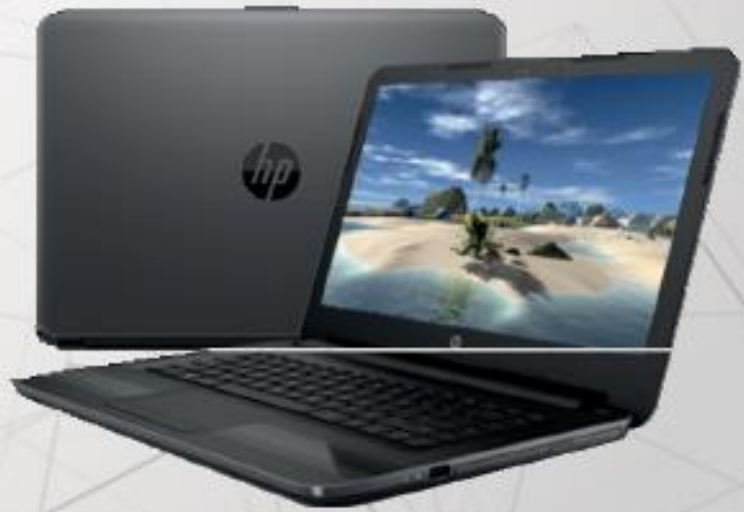
4 GB ram, 500 GB, 14 pulgadas, Windows 10 Home