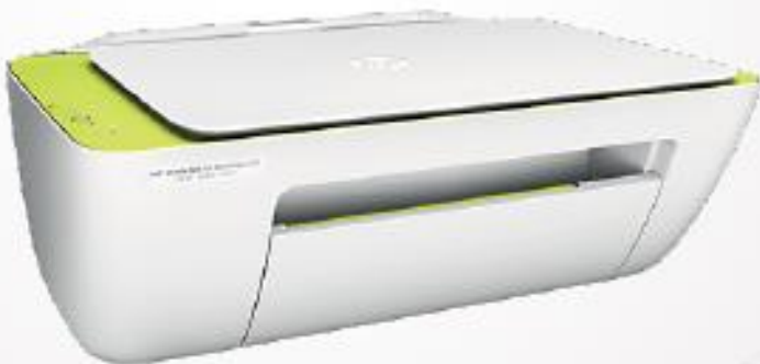
Impresora HP 2135