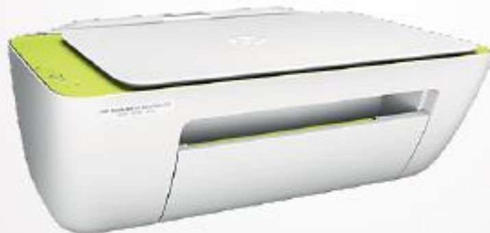
Impresora HP 2135