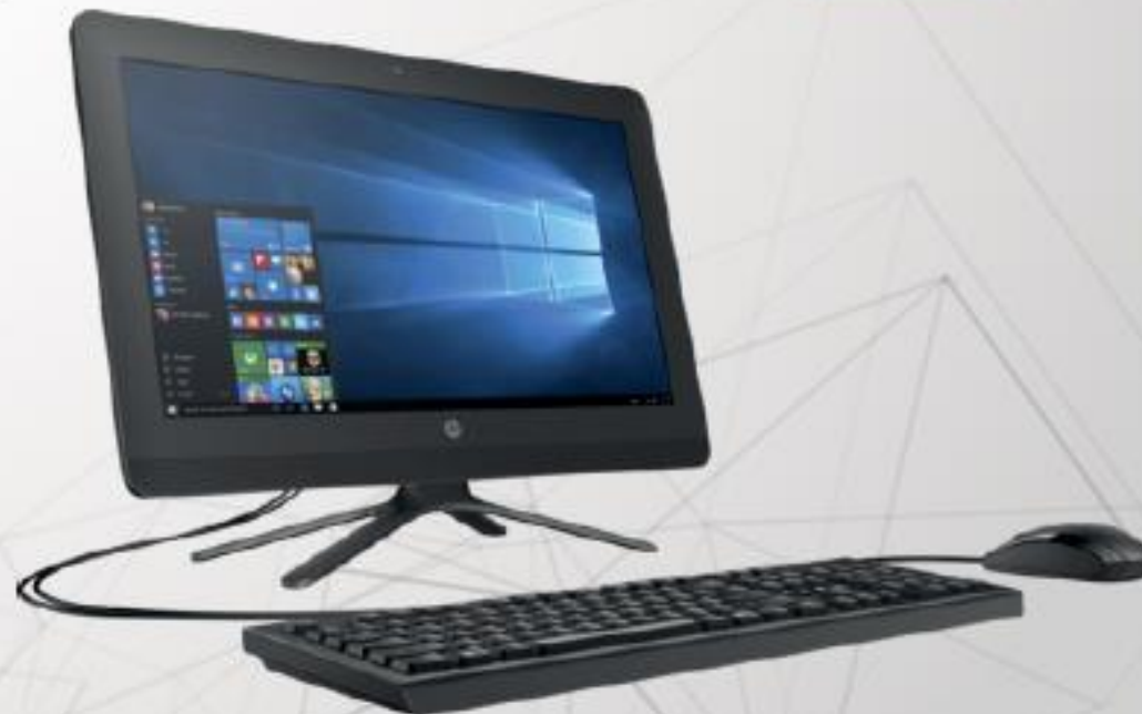
All in One, 19.5 pulgadas 4 GB, 1000 GB Windows 10 Home.