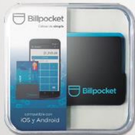
Dispositivo cobro tarjeta débito o crédito