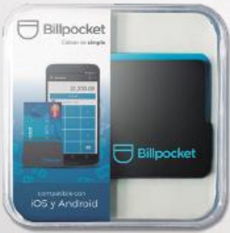
Dispositivo cobro tarjeta débito o crédito