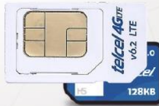
Internet simtelcel por 6 meses